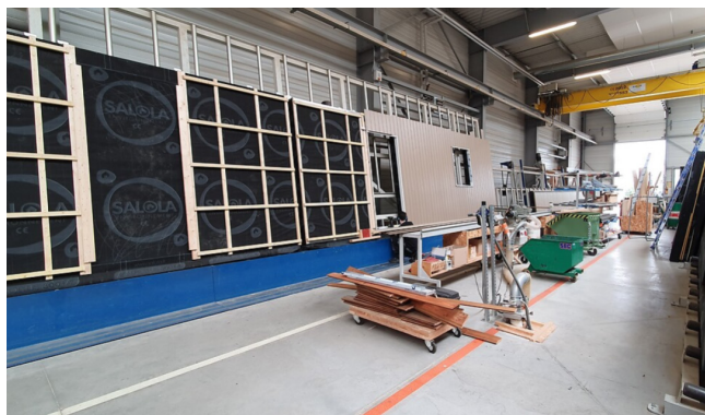
CONCEPTION EN ATELIER DES PANNEAUX INTÉGRANT ISOLATION, FENÊTRES & BARDAGES BOIS

2 mois de fabrication ont été nécessaires pour la conception des éléments en atelier, avec un temps record de pose : seulement 6 jours d'assemblage sur site !