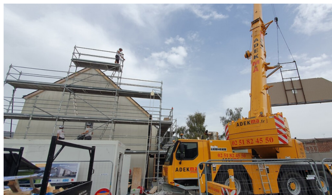
ASSEMBLAGE SUR SITE DES ÉLÉMENTS PRÉFABRIQUÉS